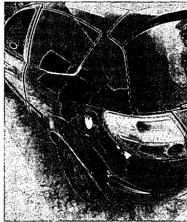
Figura 2: visão diagonal Esq.