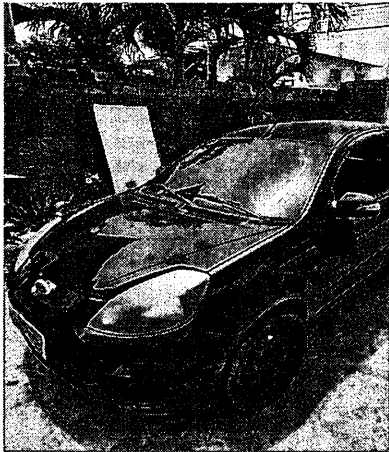
Figura 1: Visão frontal

01 (um) Automóvel marca Ford, modelo KA 1.0 FLEX 8v, ano/mod 2012/2013, placas NUI-9229, cor preta.