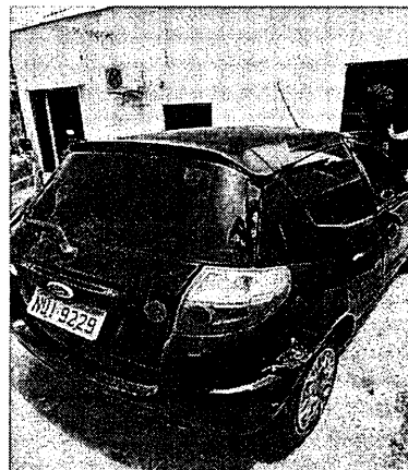
Figura 4: Visão lateral dir.